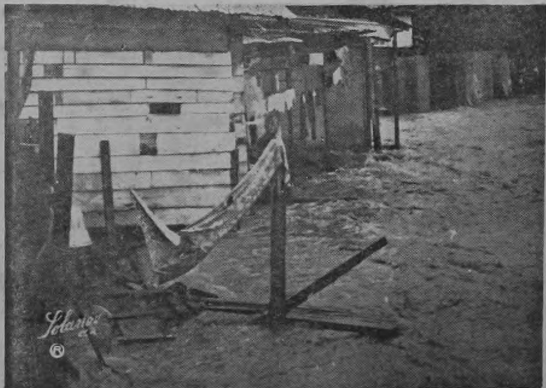
PANORAMA DESOLADOR en el barrio La Cruz. A través de todas estas humildes casas corría el agua lo mismo que afuera. En la foto se aprecia la correntada del riachuelo Ocloro. En realidad

aquí el agua corre normalmente tres metros más abajo. El agua estaba pasando al nivel y sobre el puente del barrio La Cruz.