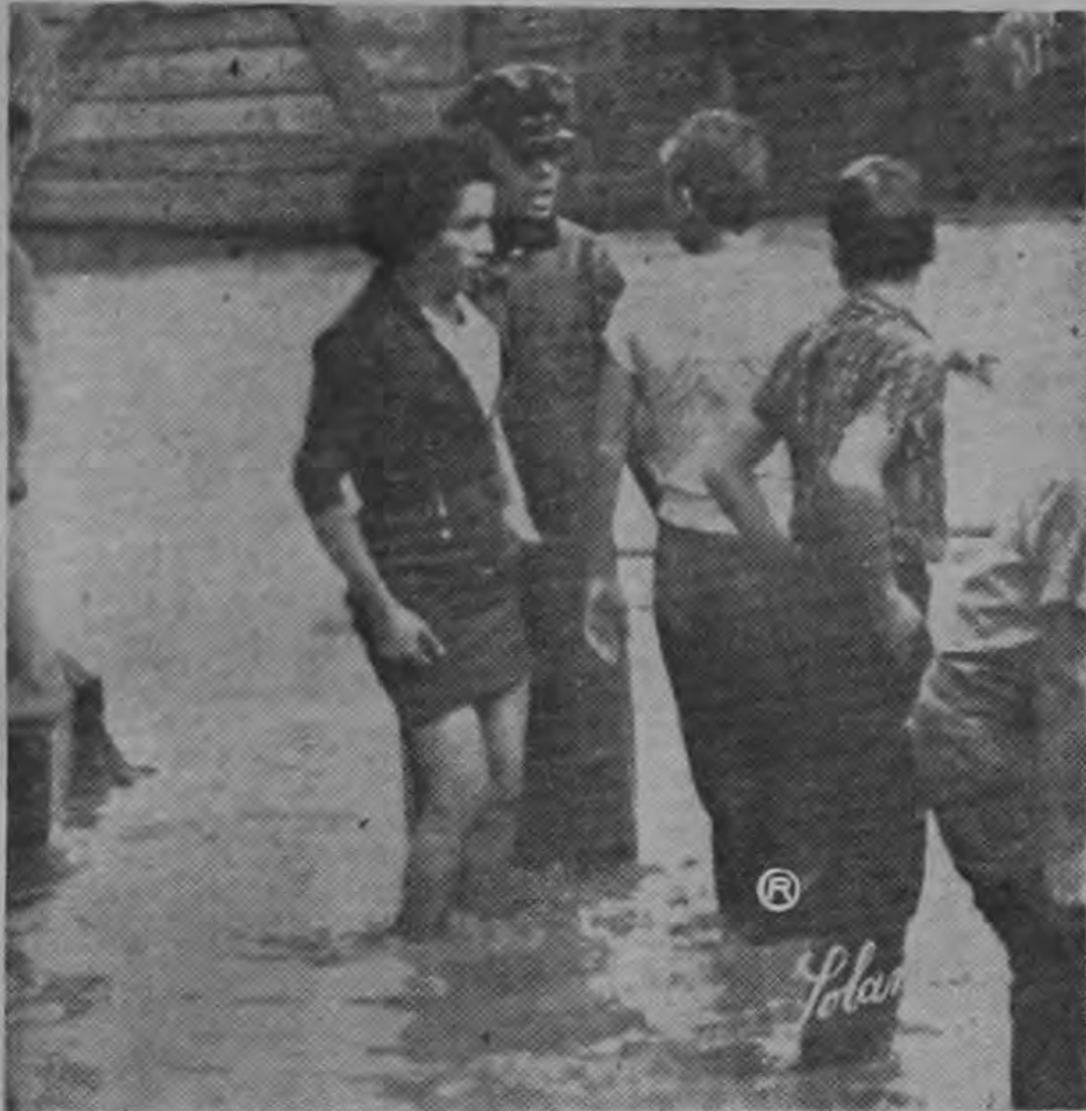
SALVANDO A UNA FAMILIA. Un miembro de Radiopatrullas acompaña a una dama que sale de su inundada casa. Ella no se resigna a dejar todas las cosas a merced de la corriente, pero el patrullero insiste en que debe salir con sus familiares (derecha).

Entre las 15 y las 17 horas de ayer se produjo alarma general en la ciudad debido al fortísimo aguacero que cayó durante este lapso.