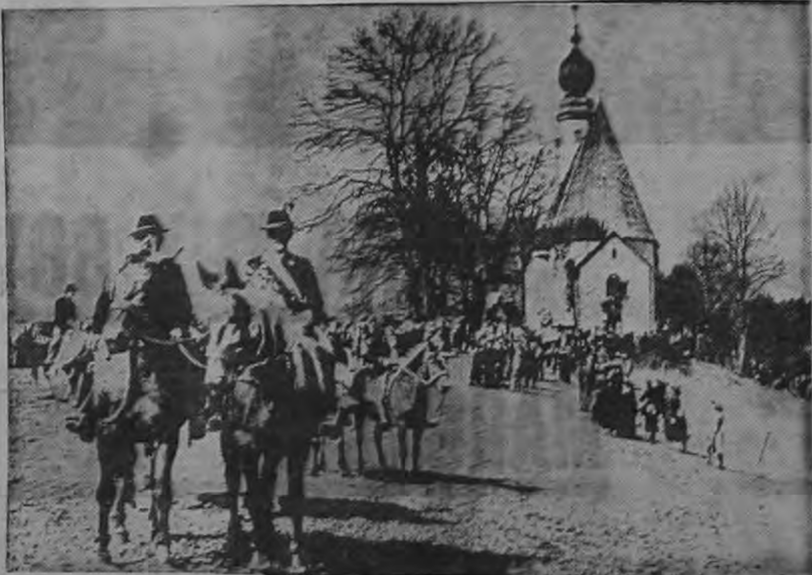
UNA VIEJA COSTUMBRE DE PASCUAS es el Georgi-Bilt (foto). La cabalgata que todavía hoy se celebra en algunos sitios de Baviera en honor del patrono San Jorge. Cada vez se ven menos escenas pintorescas en la Alemania Occidental, tradiciones de una época en que los hombres no conocían todavía ninguna industria ni tampoco grandes ciudades superpobladas con problemas de tráfico. La liebre y los huevos de Pascua son todavía hoy símbolos de esta fiesta conocidos y queridos en todas partes de Alemania. En cada

tre el Gobierno de México y la Unesco, con vistas a la creación y funcionamiento en México, durante un plazo mínimo de diez años de un Centro destinado a realizar investigaciones y estudios, facilitar el intercambio de conocimientos y experiencias, proporcionar ayuda para la selección, planificación y ejecución de proyectos que tengan importancia continental.