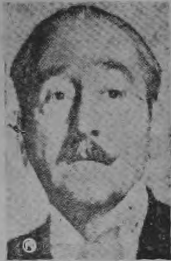
ADOLPHE MENJOU, el caballero aficionado de las cintas cinematográficas que acaba de fallecer. Menjou era representativo de toda una época del cine.

"Esta es la ayuda que el gobierno de los Estados Unidos está enviando a Cuba con motivo del huracán", dijo Castro.