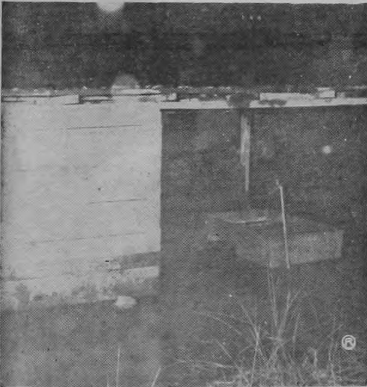
AGUA SUBE MAS DE UN METRO. La elocuente gráfica muestra cuánto subió el agua, pues la pila que se ve a la derecha centro, está casi cubierta. Aquí el nivel del agua alcanzó un metro treinta centímetros. Todo lo que había en la humilde casa se dañó o fue arrastrado por el agua. (Foto SOLANOV).